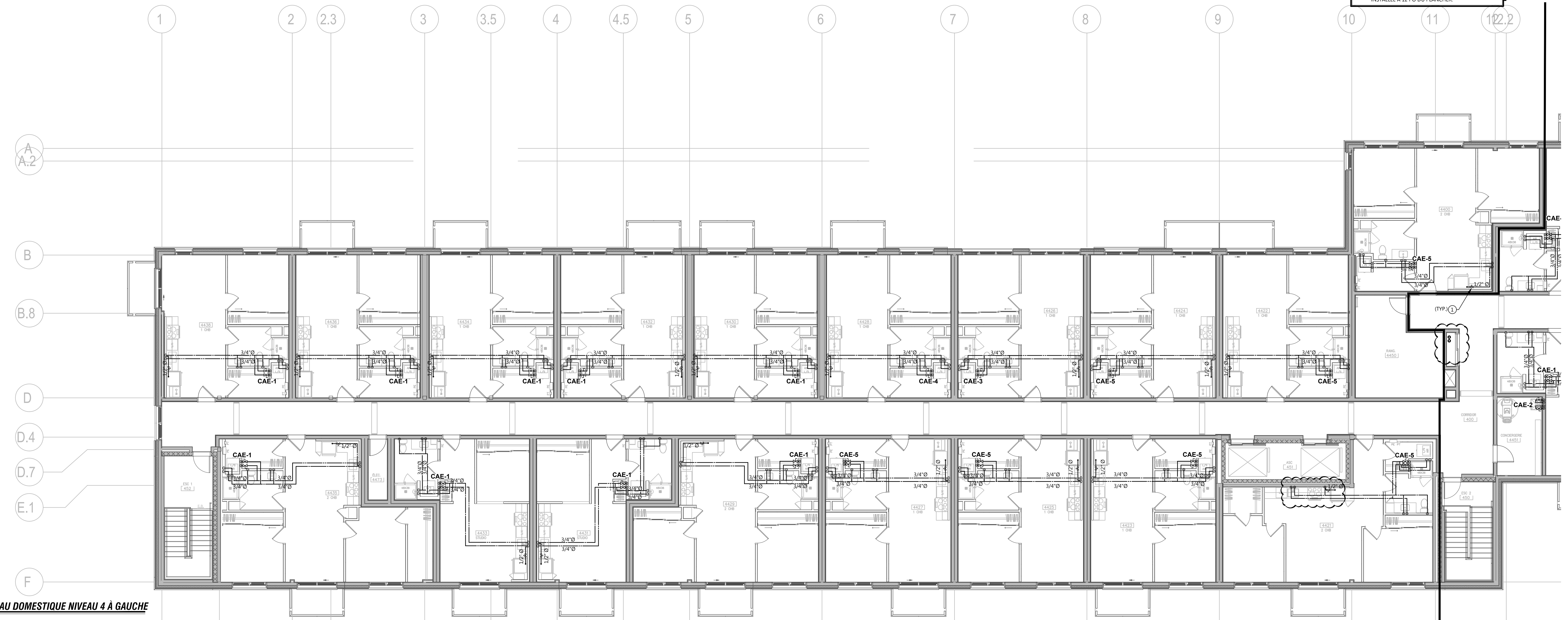
PLAN D'AMÉNAGEMENT EAU DOMESTIQUE NIVEAU 4 À GAUCHE ÉCHELLE 1/8" = 1'-0"