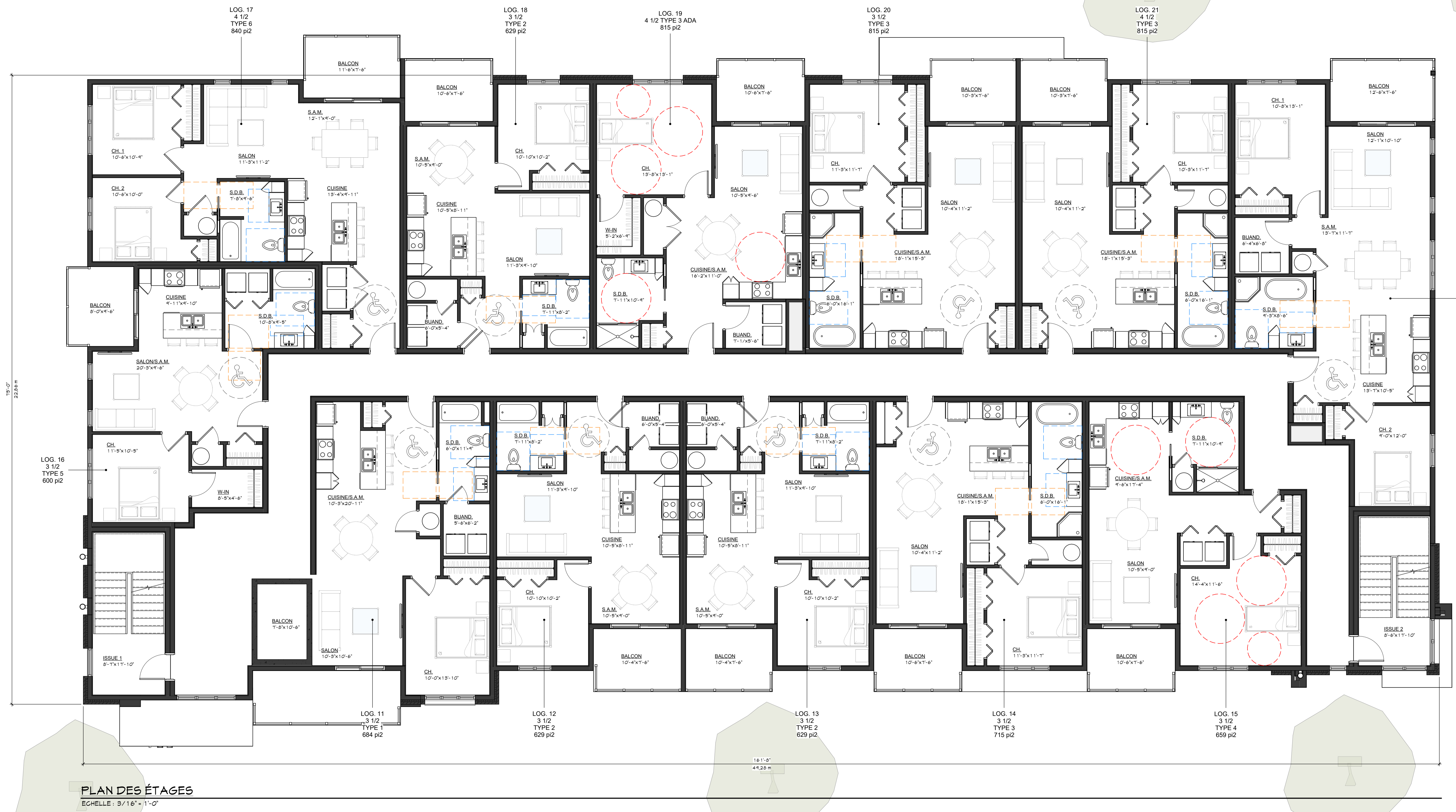
PLAN DES ÉTAGES ECHELLE : 3/16" = 1'-0"