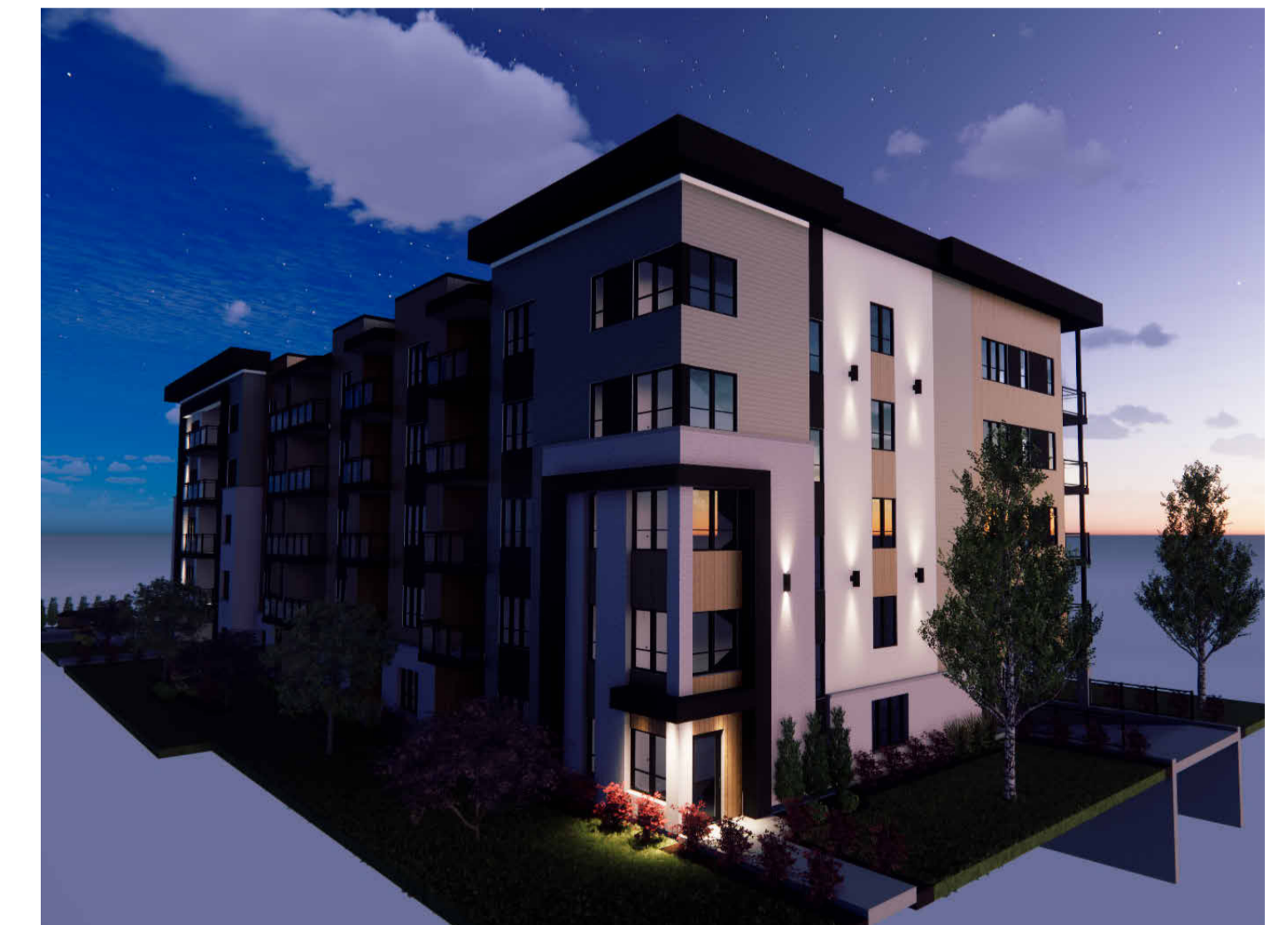
PERSPECTIVES À TITRE INDICATIF SEULEMENT